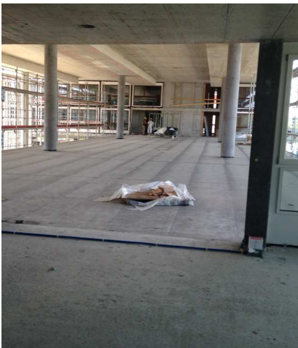
Sicht aus dem Speisesaal zum gedeckten Sitzplatz