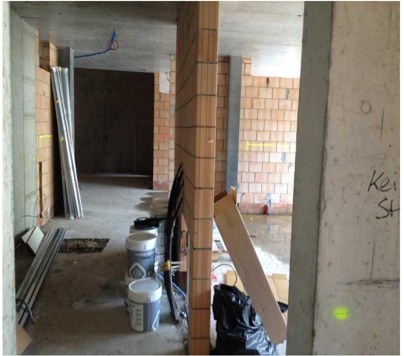
Es gibt noch einiges zu tun