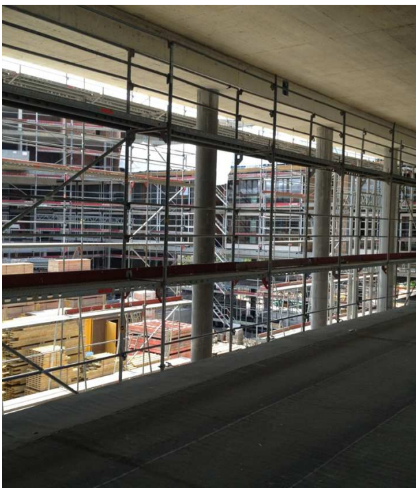
Blick in den Innenhof