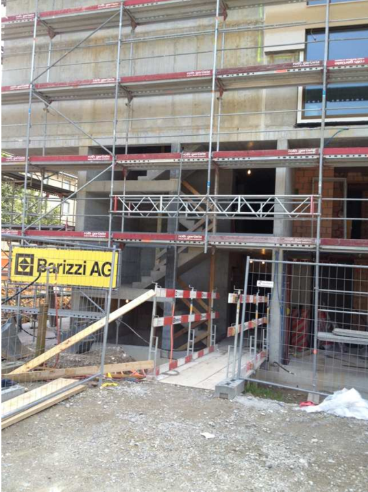
Eingang zum Neuwies im Lichthof