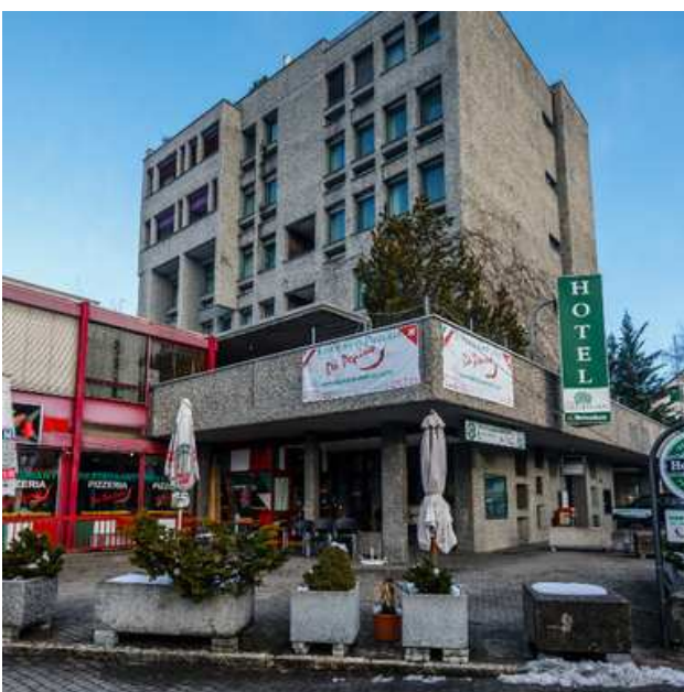
HOTEL DREI LINDEN

Der Tages- und Wochenablauf mit allen Aktivitäten wird wie bisher angeboten.