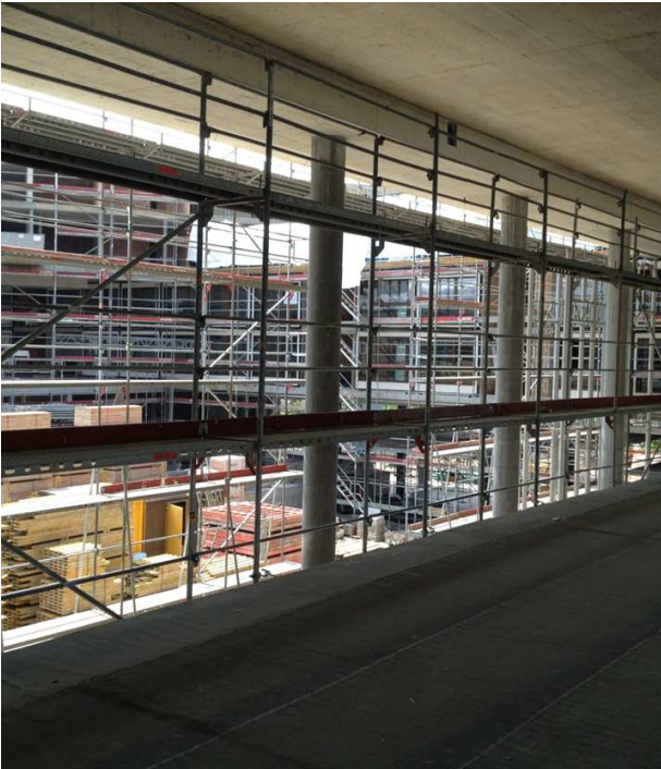
Blick von der gedeckten Terrasse beim Speisesaal in den Innenhof