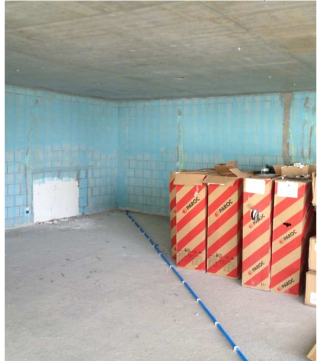
Der zukünftige Speisesaal