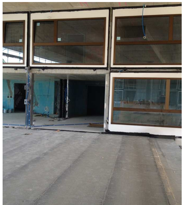
Sicht vom gedeckten Sitzplatz zum Speisesaal